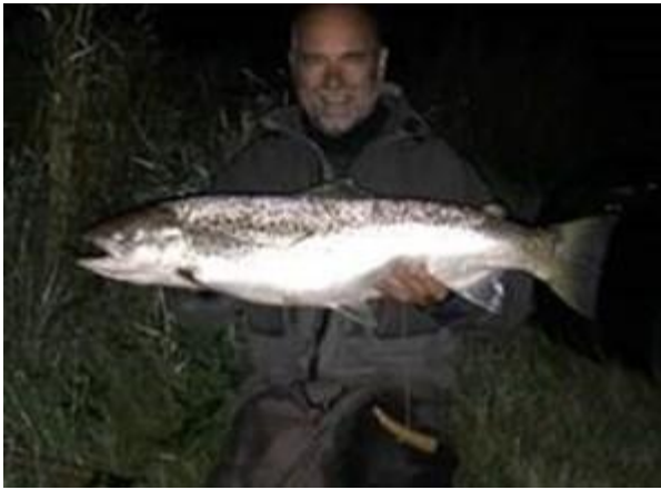
86 cm 6,8 kg