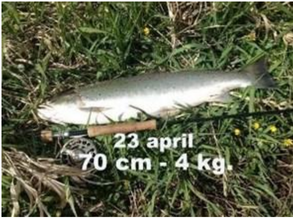
Masser af fisk