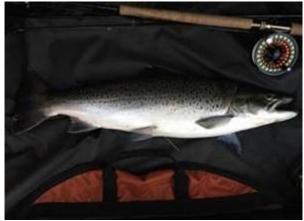
81 cm 6,1 kg