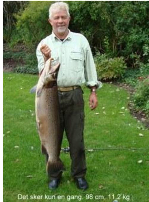
Det sker kun en gang, 98 cm, 11,2 kg