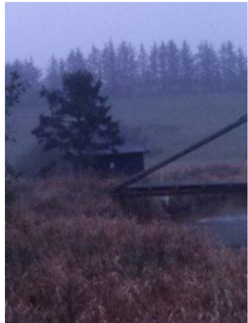
Stemmingsbillede ved Voldstedhytten