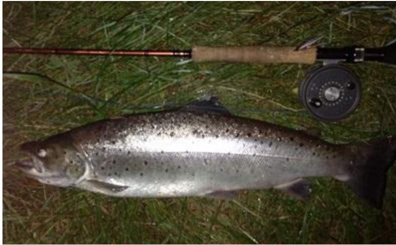
Fisken fra den 11.07